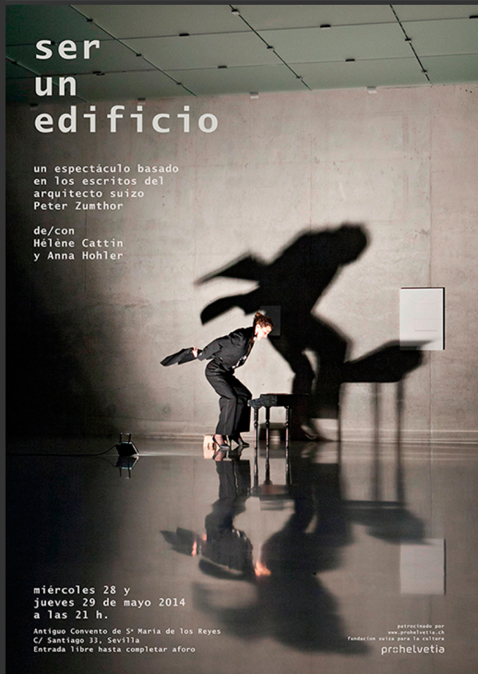
'ser un edificio', un espectáculo de la Compagnie un tour de Suisse.

Por: metalocus, SARA REBOLLO Categorías: Arquitectura, Arte